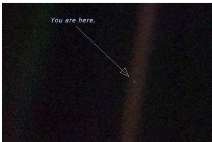
Pale Blue Dot